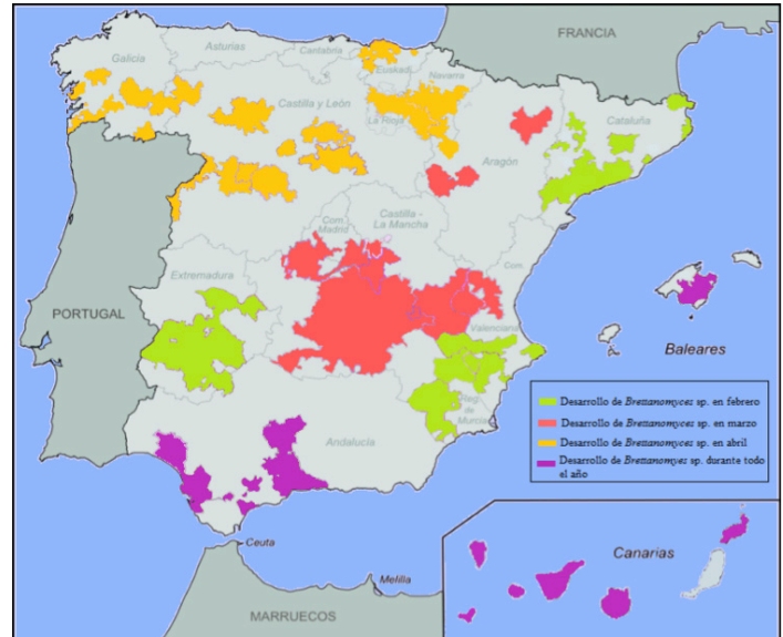
Figura 1: Desarrollo de la población de Brettanomyces bruxellensis según la temperatura y altas presiones relativas.

En el mapa (Figura 1) adelantamos los momentos de detección y control contra las Brettanomyces spp. más adecuados según la zona climática.